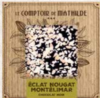
TABPM0010 TABLETTE CHOCOLAT NOIR ÉCLAT DE NOUGAT 80G