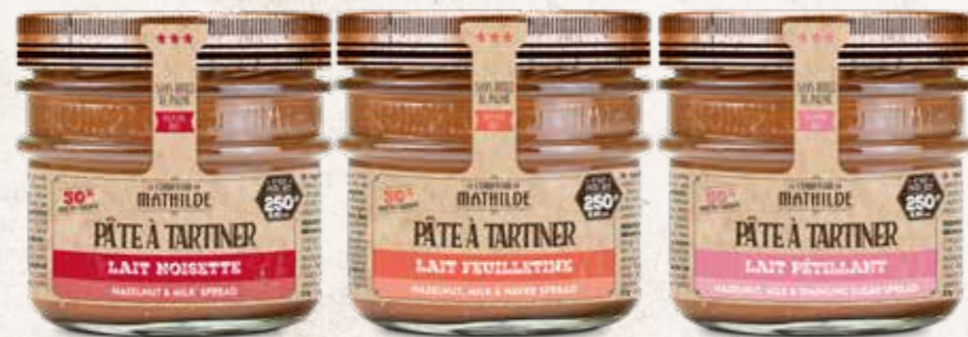
PATES0001 PÂTE À TARTINER LAIT NOISETTE 250G