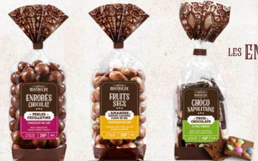
TURB10017 PERLES FEUILLETINE CHOCOLAT AU LAIT SACHET 200G