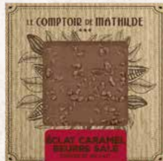
TABPM0020 TABLETTE CHOCOLAT LAIT ÉCLAT DE CARAMEL AU BEURRE SALÉ 80G