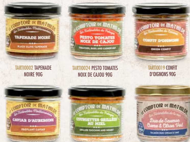
TARTI0002 TAPENADE NOIRE 90G