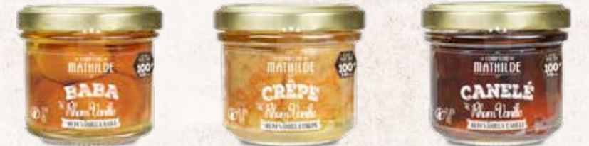
BABAS0019 BABA AU RHUM SAVEUR VANILLE 12% VOL. 100G