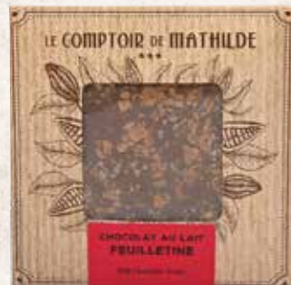
TABPM0023 TABLETTE CHOCOLAT LAIT FEUILLETINE 80G