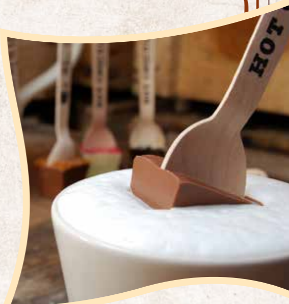
HOTCH0010 HOT CHOCOLATE CHOCOLAT LAIT SURPRISE PARTIE 30G