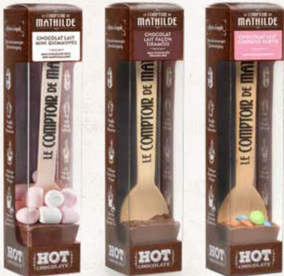
HOTCH0015 HOT CHOCOLATE CHOCOLAT LAIT MINI GUIMAUVES 30G